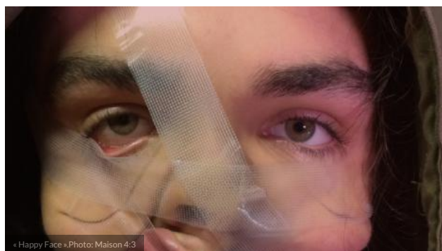
« Happy Face »